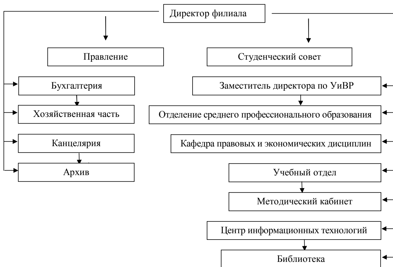
Рис. 1. Схема управления филиалом

Одним из перспективных направлений совершенствования структуры филиала является дифференциация кафедры филиала и создание ученого совета филиала. В настоящее время основные вопросы организации деятельности филиала определяются решениями ученого совета Алтайского государственного университета (академическая и кадровая политика, планирование научных исследований, экономического и социального развития филиала, создание и развитие собственной нормативной базы). Расширение штата научно-педагогических работников филиала и увеличение числа административно-управленческих структур делает возможным создание собственного ученого совета филиала.